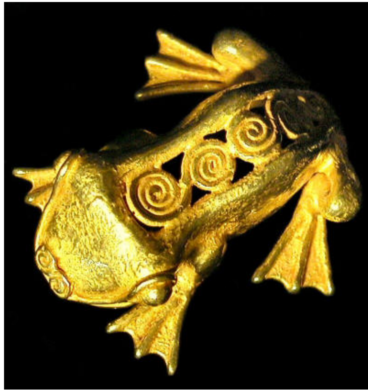
Une gre-nouille col-lection privée