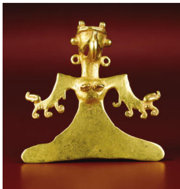
Un oiseau du Costa Rica Col-lection Hendershott

Les images que vous avez vu représente des oiseaux stylisés plus au moins réalistes, mais si nous les comparons aux objets posant un problème de comparaison :