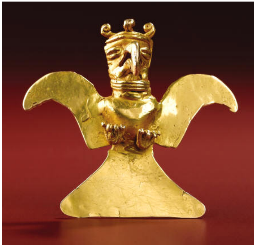
Un oiseau du Costa Rica Collection Henderson