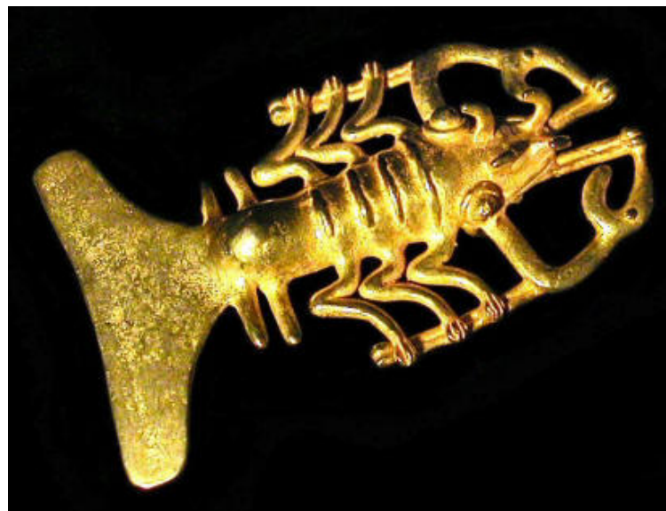
Un homard col-lection privée