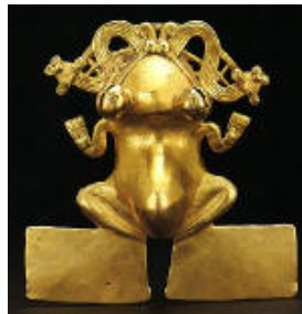
Une gre-nouille col-lection privée