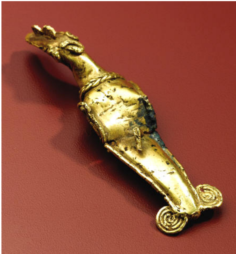
Un oiseau du Costa Rica Col-lection Hendershott