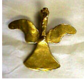
Un aigle de Veraguas au Panama collection privée

Effectivement, ses objets dit pendentif font partis de ceux en forme d'animaux volants. Malgré tout ses objets ne ressemblent pas trop à des oiseaux connus du fait qu'il y a deux ailes de chaque côté parfaitement planes et une queue bien verticale. Peut être un poisson volant, mais un poisson de ce type n'a jamais été vu jusqu'à présent. Regardons d'autres objets dit zoomorphes :