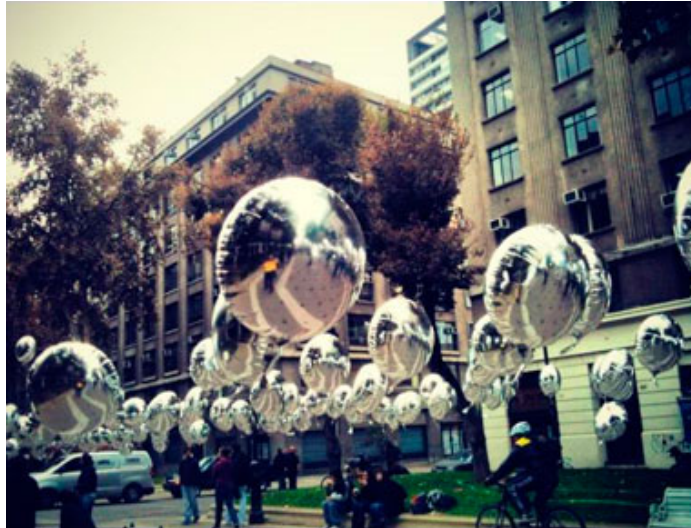
Ballons argentés gonflé à l'hélium envoyé le 11 mai 2012

Mais nous pensons que cette explication est vraisemblablement la bonne