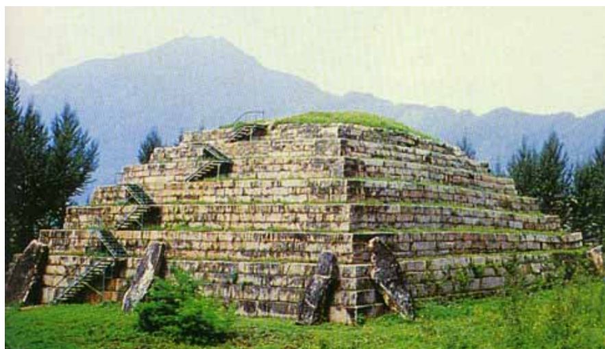
Pyramide de Zangkunchong